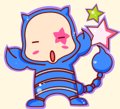
Scorpio | 天蝎座

总运指数颇高，事业学业发展顺利，表现机会较多；获得爱情的机会较多，但容易出现自恋甚至自负的情绪，认为对方的条件无法达到自己的标准，会因此错过不少天赐良缘。月中易出现转机；财运较好，证券之类的投资易有收获，风险无处不在，宜谨慎。