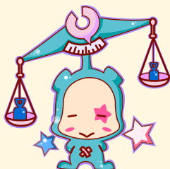
Libra | 天秤座

总运势较平顺，爱情运势不错，恋情发展较顺利，把握好尺度。事业运较差，工作者容易遇到难题，需要保持积极的心态。与同事进行必要的交流，找出问题的症结。从不同的角度考虑问题，容易突破局限，使问题迎刃而解。财运一般，要注意树立良好的理财观念。