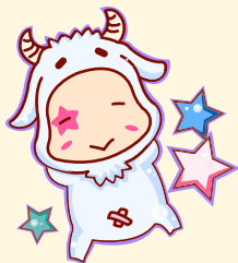
Aries | 白羊座

本月日子过得很精彩，吃喝的节目不少。上旬，你会有忙里偷闲的机会，让你的生活层面得到更广的拓展。手中的事情虽然重要，但并不急于一时，时间还是很充裕。下旬，注意应付各项事务的弹性，将之条理分明，以免遇到突发事件，乱了阵脚。