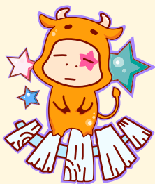
Taurus | 金牛座

偶尔跳脱常规，你将发现日子并不是那么枯燥无味，你的心情也活跃了起来，摆脱了往日所有的阴霾，对许多事都有了正面的想法。试着做点以前没有尝试过的事，你会感觉生活丰富多彩！不管是别人的搭讪或者你的主动，都是个不错的开始，千万不要错过哦。