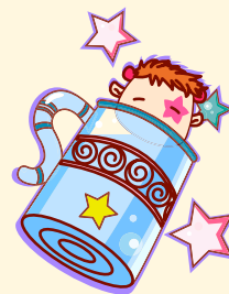
Aquarius | 水瓶座

运势较弱，工作上难以施展所长；重视物质大于精神的爱情，让你的感情得不到健康的发展；多与周围的朋友沟通，有机会通过介绍结识不错的异性，若能长远的看待问题，深入了解对方，容易获得美好的爱情。赚钱的机会很多，要慎重选择并好好把握。