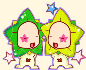
Gemini | 双子座

本月总体运势较差，爱情际遇较少，单身者不可强求，心态平和是关键；事业学业稳步发展中，积极的心态让工作得到顺利进展。财运一般，还得主动些，不可有“天上掉金币”的侥幸心理。显得有些浮躁，时常面临感情困扰。学会包容与体谅，多看对方身上的优点。