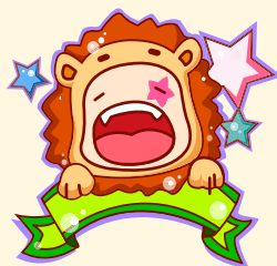
Leo | 狮子座

你本月运势的强盛表现在事业学业的成功和投资理财的精明之上，整个月你在这两个方面都是稳中有升。你的决策优势特别明显，若是有想要扩大事业的想法，不妨早做计划。然而，由于你用过多的精力去追逐名利，造成对爱情有所忽略。