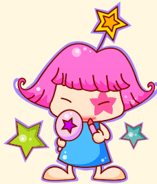
Virgo | 处女座

这个月整体运势不错，虽然爱情运的走弱让你有点头疼，出现一些负面的影响，但其他运势可谓是一帆风顺。努力的工作很容易取得成绩，并获得上级的嘉奖。但是在偶尔情绪比较烦闷的时候，一定要克制住自己的情绪，不要与同事争执。本月身体情况不错，可多做运动。