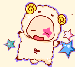
Capricorn | 摩羯座

总体运势略低，桃花虽多，但不易获得真情；工作易有失误，注意调整心态；财运不佳，应务实别投机；另外，做事、玩乐时别太鲁莽，容易撞伤或扭伤。求财看似容易，却需要付出很大的心力。适合谋求智慧财、专业技能财，对乐透、彩票等不要心存侥幸。