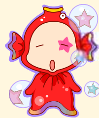
Pisces | 双鱼座

此月你的整体运势一路红红火火。在事业上，上班族对待工作的热情和积极性都很高，你的思维一直处于活跃状态，常常产生很多好的想法和创意。不过，中旬容易因沟通不畅和他人争执，要尽量避免。不过，本月在投资理财方面要审慎行事，切勿贪多反失。