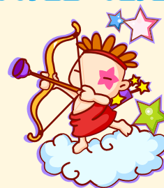
Sagittarius | 射手座

这月矛盾重重，想努力做事，但运势较差，总是不尽人意。于是有时感觉很失望，没有自信心，而有时又觉得不甘心，想努力奋斗。劳心费神，建议你要么放手，好好调整；要么不论遇到什么困难，一直努力往前冲。在相处中，彼此要多一点宽容和理解，这样才会感到幸福。