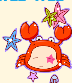
Cancer | 巨蟹座

不平静一个月，各方面运势都如波浪般起伏，时高时低。随着时间的推移和个人的努力，工作会渐入佳境。成绩也越出色，进入一个良性循环。只是到了月末会因感情困扰，而显得有些力不从心。财富上进钱似滴水，花钱如流水，再大的金库都有可能干涸。